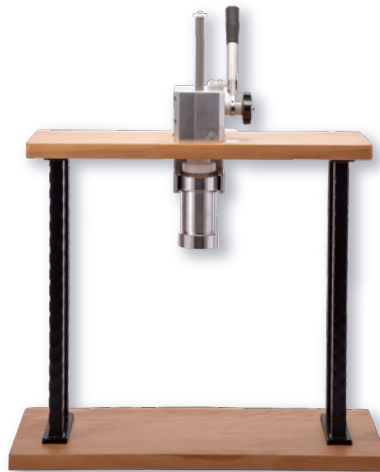
モンブランマシン (木枠モデル) ㊦

ページコード 商品コード 価格 4-1014-0301 2126930 ¥250,000 外寸:320×560×H635 枠H545 最大H810 材質:ステンレス、アルミニウム、樹脂 ●絞り部分は取り外し・分解洗浄が可能。衛生管理がし易く、絞りロプレートも付け替えが可能です。 ●基本付属品として、4枚のプレート(穴直径1.0mm×2種、1.5mm×2種)が含まれます。個別オーダー可能 ●大きなお皿でも使用可能です。 機構部のみ 4-1014-0302 2126960 ¥180,000 ㊦での販売