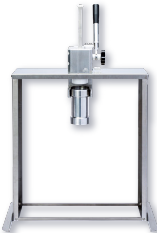
モンブランマシン (スタンダードタイプ) ㊦

国産メーカー製造による安心品質 シリンダー、絞りロプレートは取り外し・分解洗浄が可能で衛生的 和栗ペーストをはじめ、ペーストのご相談もOK