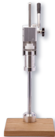
モンブランマシン (スリムモデル) ㊦

ページコード 商品コード 価格 4-1014-0401 2126940 ¥300,000 外寸:295×620×H655 枠H560 最大H825 材質:ステンレス、アルミニウム、樹脂、天然木 ●絞り部分は取り外し・分解洗浄が可能。衛生管理がし易く、絞りロプレートも付け替えが可能です。 ●基本付属品として、4枚のプレート(穴直径1.0mm×2種、1.5mm×3種)が含まれます。個別オーダー可能 ●大きなお皿でも使用可能です。