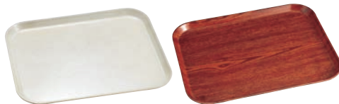
⑬ アンチークパーチメント(A/P)